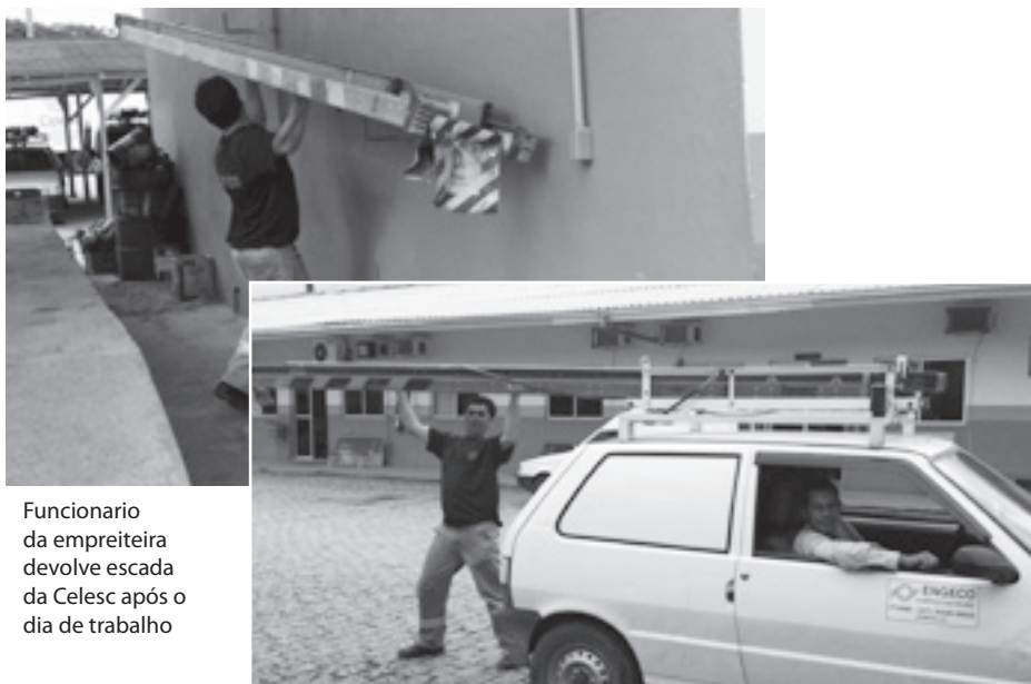
Funcionário da empreiteira devolve escada da Celesc após o dia de trabalho

Os carros da Supervisão Técnica Comercial estacionados no pátio da Agência Regional de Joinville tiveram suas escadas retiradas e cedidas à empreiteira que realiza corte, religações e ligações novas na cidade. Segundo trabalhadores que denunciaram a situação, a chefia da supervisão comunicou que a empreiteira estaria sem o material para trabalhar e por isso, as escadas seriam emprestadas até que as condições de trabalho fossem normalizadas. De acordo com depoimentos, as escadas da empreiteira foram deslocadas para Criciúma. A responsabilidade de fornecer ao trabalhador o material necessário para a execução de sua função é, por contrato, da empreiteira e ao ceder os equipamentos da Celesc fica clara a falta de respeito com os trabalhadores próprios e com o bem público, além do descaso com o contrato vigente. Os sindicatos que compõem a Intercel registraram o fato, com fotos e depoimentos testemunhas e encaminharão denúncia aos órgãos competentes cobrando a responsabilização dos envolvidos, sejam eles quem for. A pergunta que não quer calar é: quem deu, de fato a ordem para essa irregularidade? Quais os chefes envolvidos?